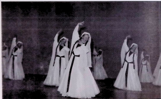
«Համազգային»ի Լուս Աճճելլի մասնաճիղի «Աճի» պարախումբի աղջիկներու բաժինէն մաս մը Այս տարի, Նոյեմբեր 10-ին, Էմպէստոր պանդոկին մէջ պարախումբը իր հիմնադրութեան տասնամեակը կը տօնէ: