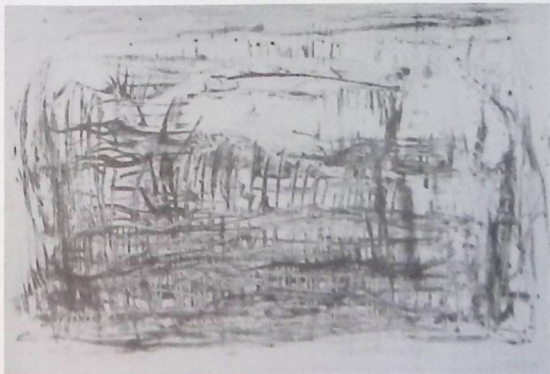
Ջրաներկ — Composition

«ՏԻԳՐԱՆԵԱՆ» ՍՐԱՀ 5300 White Oak Avenue, Encino