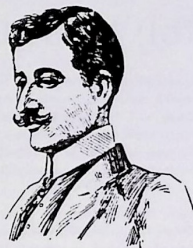
ԳԱՆԻԷԼ ՎԱՐՈՒԺԱՆ — 1884-1915