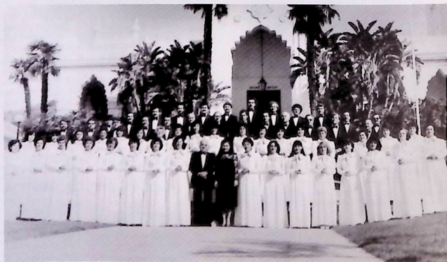
«Համազգային»ի Կլէնտլլի մասնաճիղի «Աճուշ» երգչախումբի անդամները